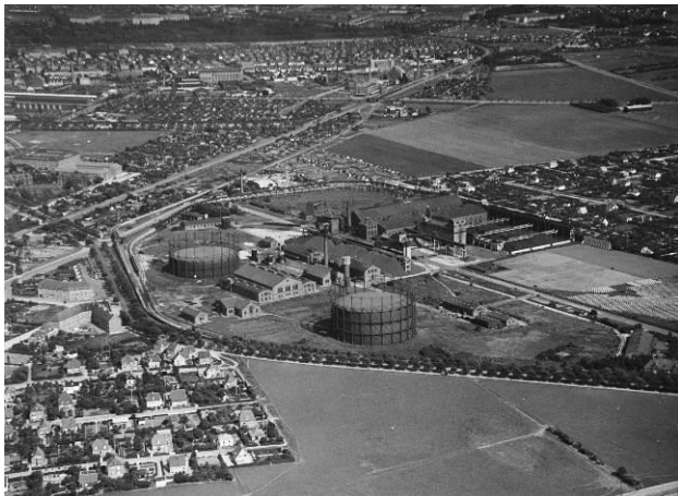
Kig fra Valby Gasværk mod Gl. Køge Landevej ca. 1930.