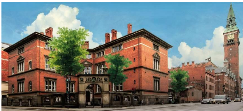
Københavns Museum på hjørnet Stormgade/Vester Voldgade.

Torsdag 13. januar 2022 kl. 16.15. Omvisningen slutter kl. 17.30, hvorefter man kan gå rundt på egen hånd. Museet lukker først kl. 21 om torsdagen.