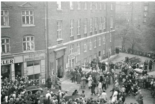
Opsamlingsstedet Gl. Jernbanevej 25 lige efter befrielsen.

Torsdag 24. marts 2022 kl. 14.45 Cirka 15 deltagere