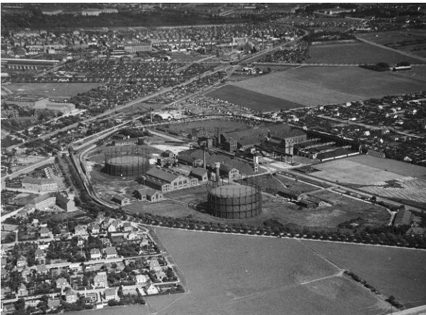
Kig fra Valby Gasværk mod Gl. Køge Landevej ca. 1930.

Tirsdag 8. februar 2022 kl. 19.30 Cirka 25 deltagere