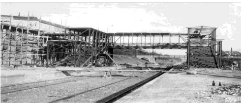
Valby Station under opførelsen

Tirsdag 20. september kl. 19.30 Cirka 30 deltagere